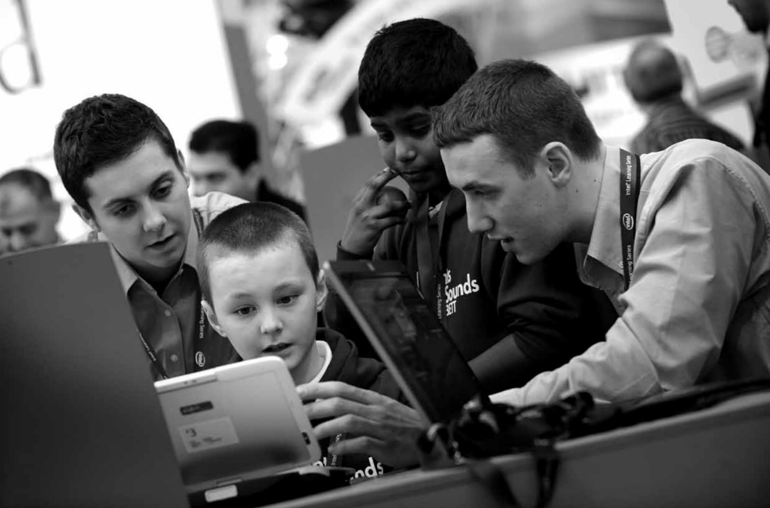
Foto: BETT 2010 at Olympia, London

hade slående likhet med den figur som tillverkaren gjort som exempel!? Idioti odlas i grupp har du väl hört tidigare, om än lite hård dom i detta sammanhang, så kan man krasst konstatera att de redskap som finns för att odla kreativiteten snyggt och prydligt ändå plockar in oss i leden.